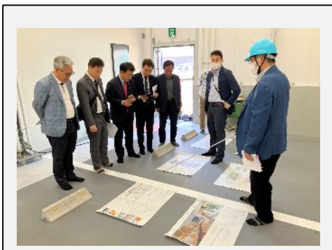
現場見学（免震構造現場）