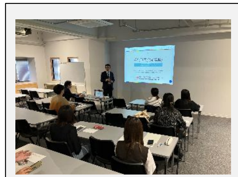
鹿児島大学 講義：韓国の伝統工法