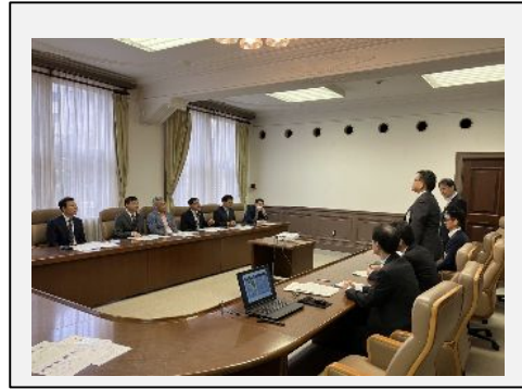
鹿児島市役所：表敬訪問