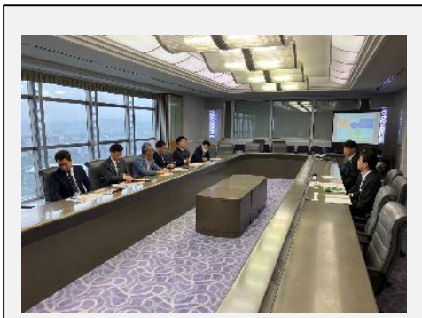
鹿児島県庁：表敬訪問