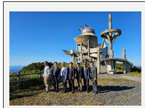
建物見学：輝北天球館